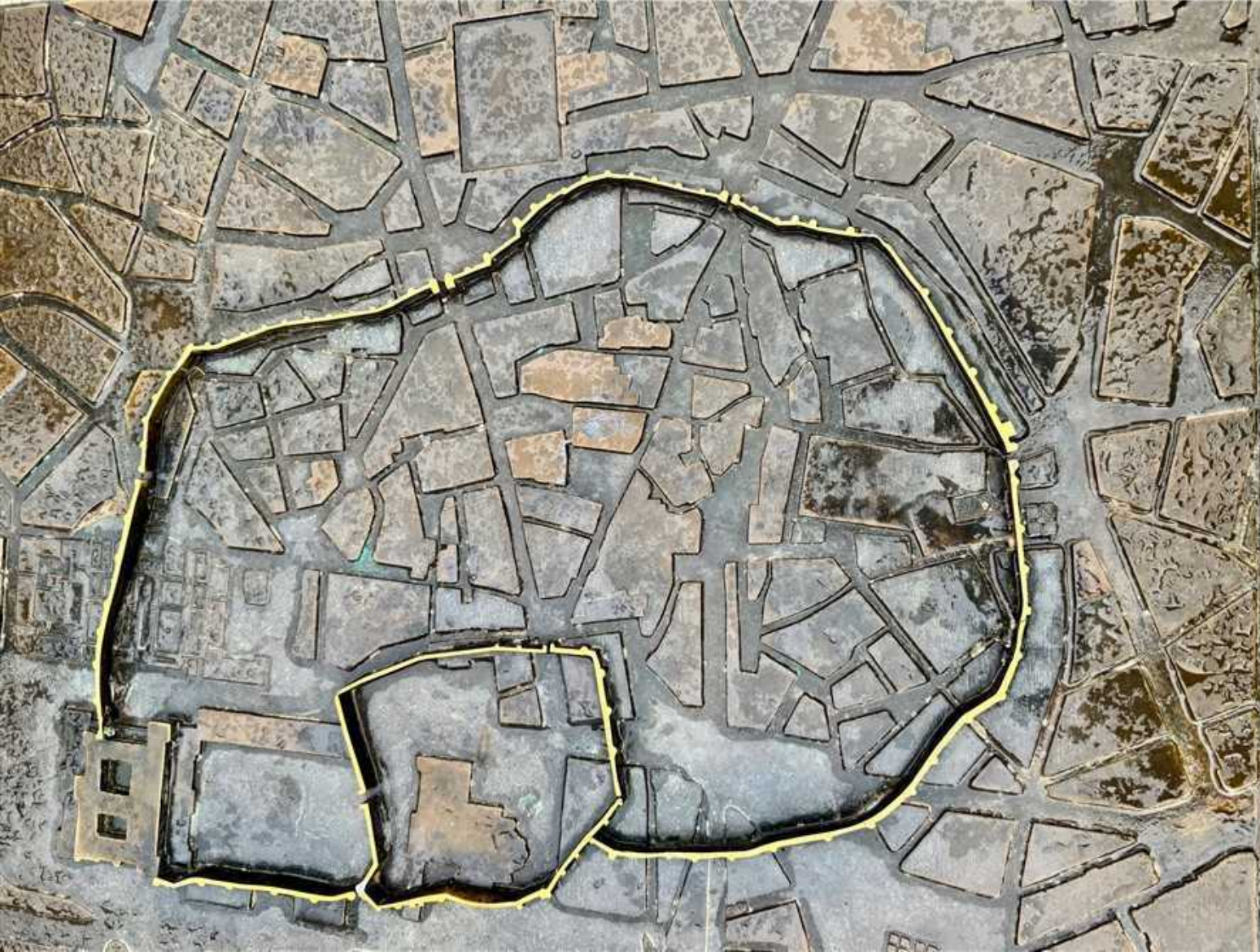
CO DE LOS BEATOS (MAYAN) ADORENDOS - POSSIBLE SITE OF THE ORIGINAL FORTIFICATIONS