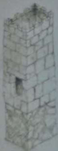
Restauración arquitectónica de la atalaya

A pesar de su estado de deterioro, ya que tan sólo se conserva la cimentación de esta torre de planta rectangular, se puede observar la solidez de su construcción realizada a base de mampostería de caliza y sílex reforzada con sillares en las esquinas. La atalaya se situaba justo al borde del barranco, y su conservación, integrándose en el proyecto del aparcamiento subterráneo, supone el recuerdo del origen más remoto de Madrid.